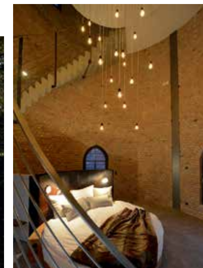
#5. Der „Wasserturm Bad Saarow“ unweit von Berlin.