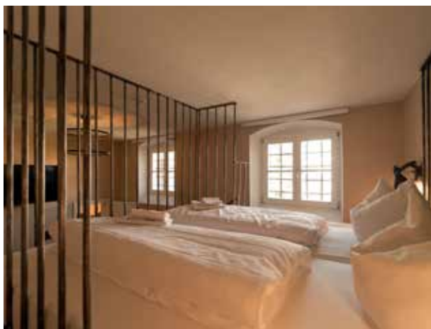
^ #9. Burgfräulein spielen im „Castillo de Monda“, Spanien.