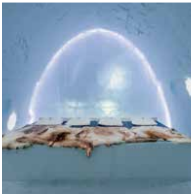
< #6. Icehotel im schwedischen Jukkasjärvi, nahe dem Polarkreis.