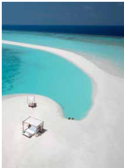
^ #8. Eigene Sandbank im „Milaidhoo“-Resort auf den Malediven.

für Sie und Ihren Schatz Platz und bietet einen phantastischen Rundumblick auf den See, den Kurpark mit seinen Thermen und die Wälder Brandenburgs!